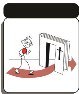
Wandel in die Woord